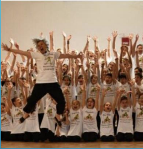
Coro e orchestra di flauti barocca